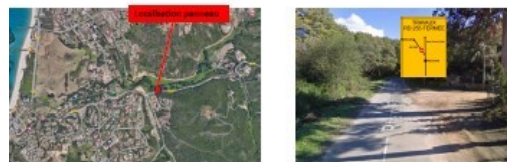
5 : Col Arghellaju