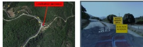
4 : Route de Pietrosella