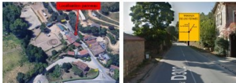
3 : Embranchement épingle de Pietrosella