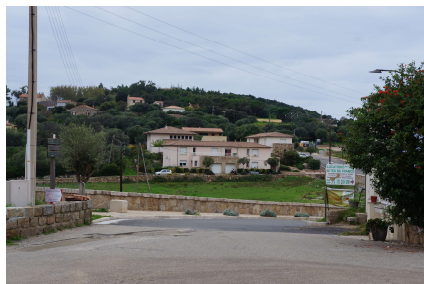
Habitat collectif locatif communal.